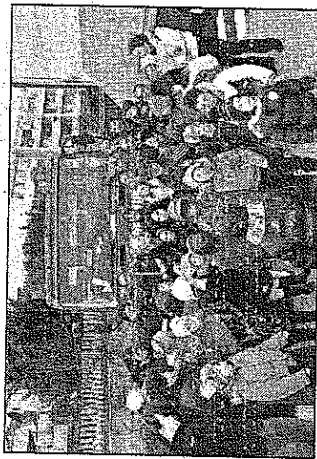
A Montesilvano la vecchiaia è arrivata con i Vigili del fuoco salutata da tanti bambini