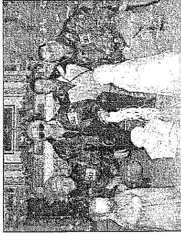
Presepe sub a Villalago, c'erano anche i pescatori