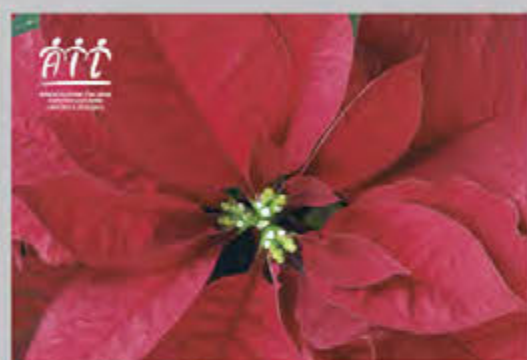
Stelle di Natale