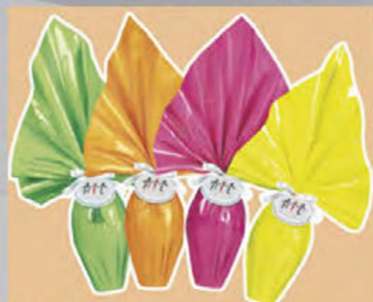
Uova di Pasqua