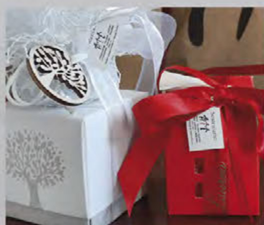
Bomboniere e pergamene solidali

DONA IL TUO 5 PER MILLE ALL'AIL SCRIVENDO IL CODICE FISCALE 80102390582