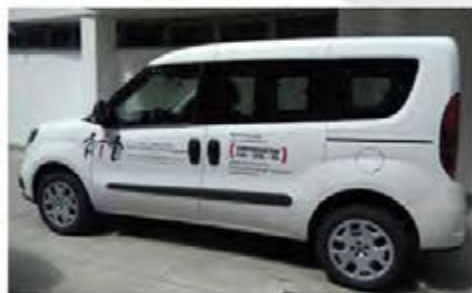
Auto di servizio

Grazie al Tuo contributo l'AIL potrà continuare ad essere il supporto del Dipartimento di Ematologia e TU a renderti protagonista di questa importante MISSIONE di solidarietà!